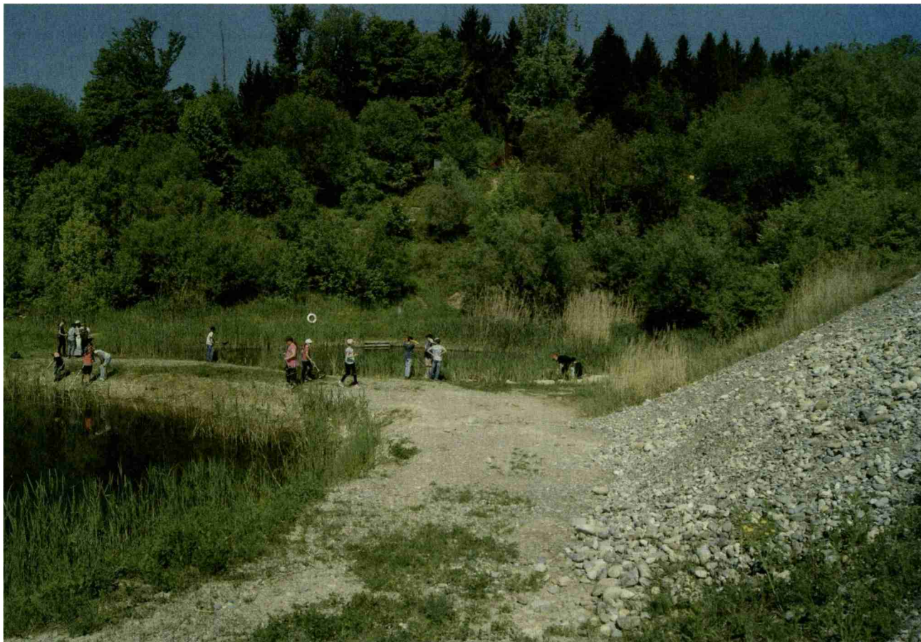
Der Lernort Kiesgrube ist ein wahres Eldorado für angehende Biologen und Geologen.

FESTIVAL DER NATUR • Im Rahmen des Internationalen Tages der biologischen Vielfalt (22. Mai) finden schweizweit über 700 Veranstaltungen statt. So zum Beispiel am 26. Mai in der Kiesgrube Rubigen.