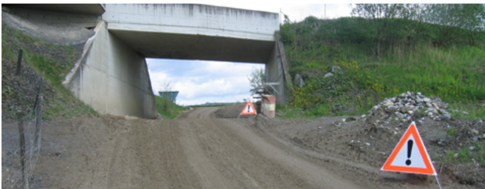
Positionierung der Sicherheitsdreiecke

Das Arbeitsmaterial muss vor dem Verlassen des Lernorts vollständig und am richtigen Ort versorgt werden. Abfälle sind korrekt zu beseitigen. Nachträglicher Arbeitsaufwand (z.B. Aufräumen, Müll sammeln usw.) wird der Besuchergruppe zu einem Ansatz von CHF 60.00 pro Stunde zusätzlich in Rechnung gestellt.